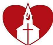
4. Filip Hovland